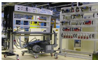
De matériel électrotechnique