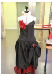
De matériaux souples