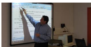
De matériel informatique